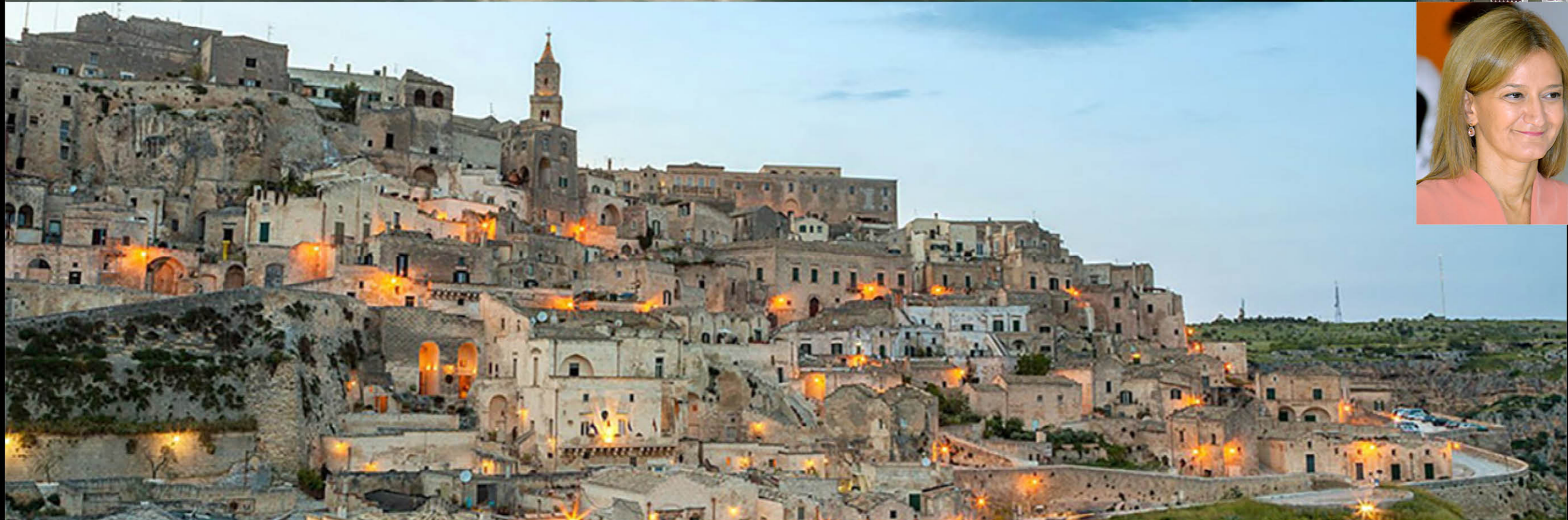
Bari e Matera, Italia.