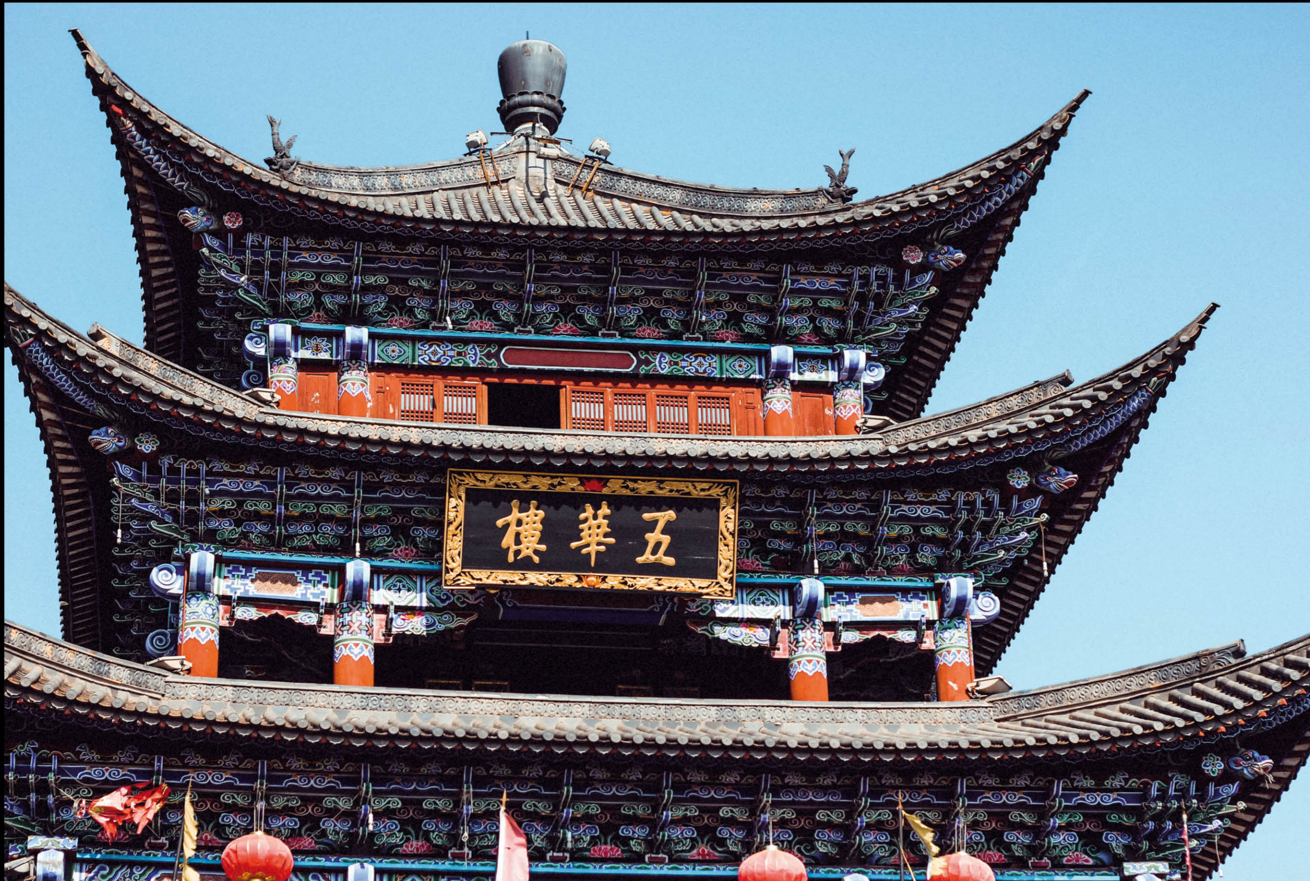
Antico Tempio, Cina.