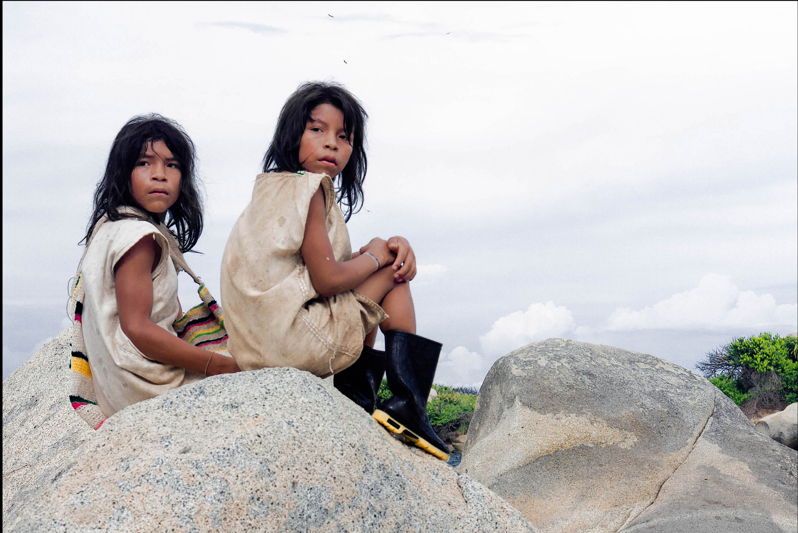
Cartagena di Indias, Colombia.