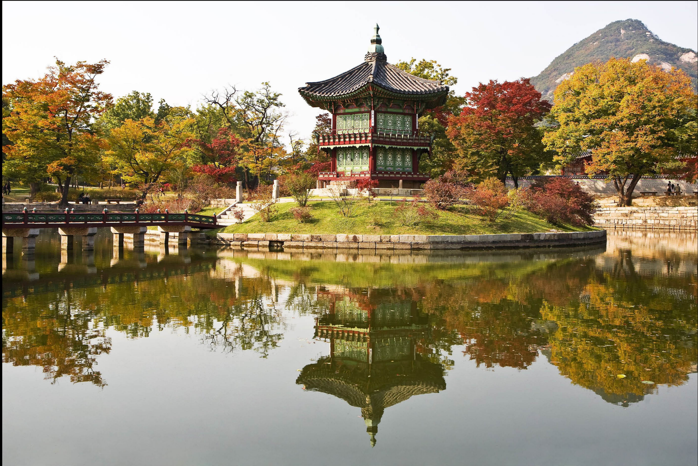
Seul, Corea del Sud.